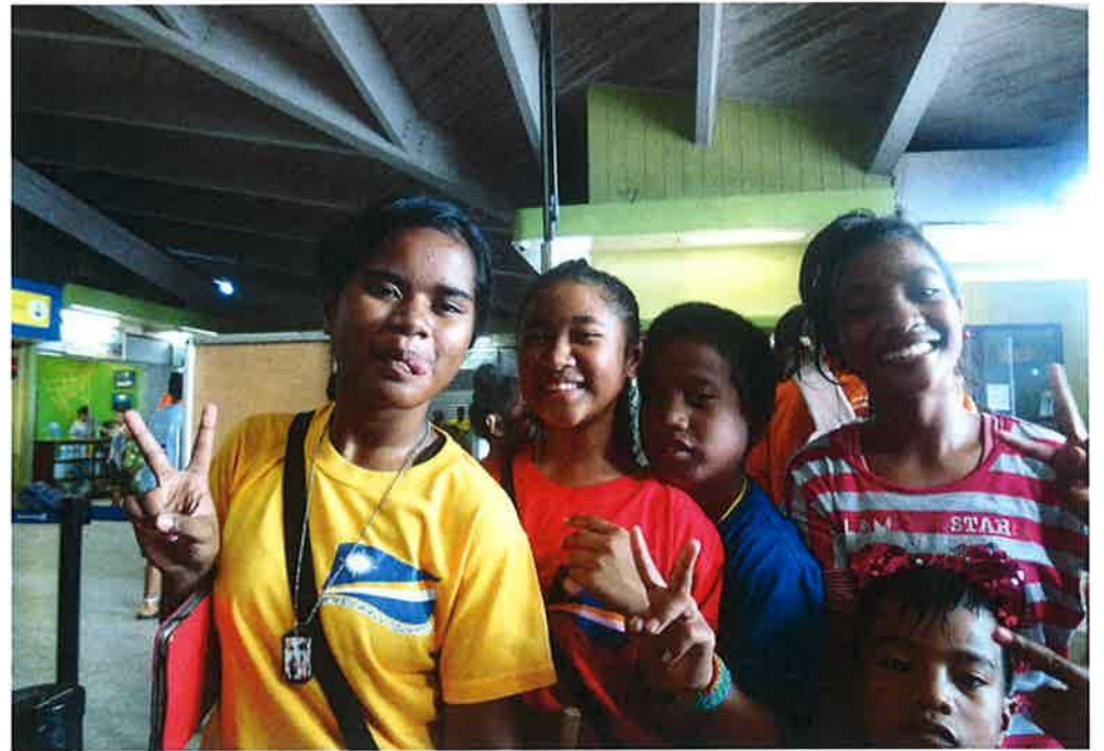
マーシャルフレンド