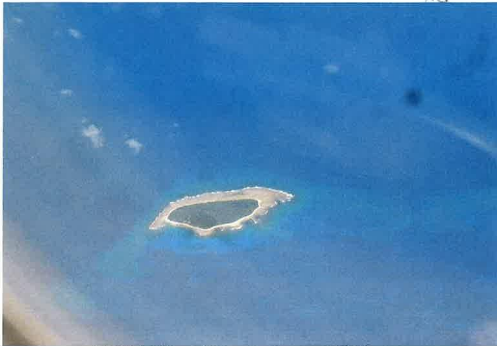
飛行機から見たマーシャルの島々