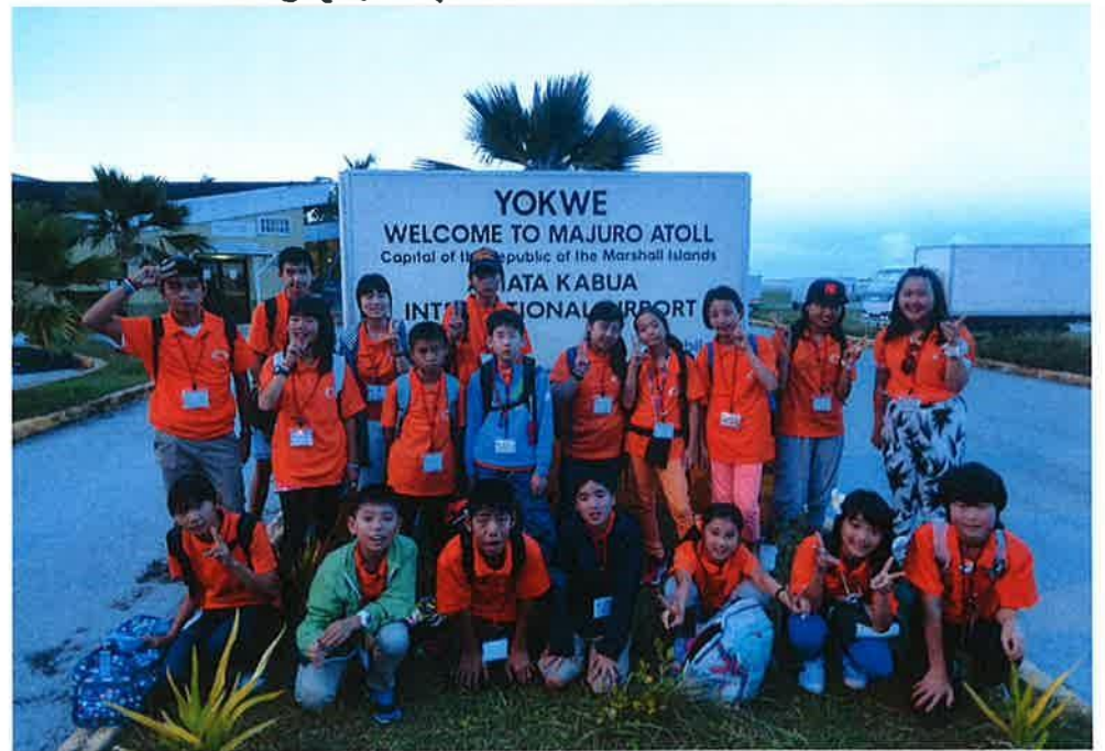
チーム マーシャル