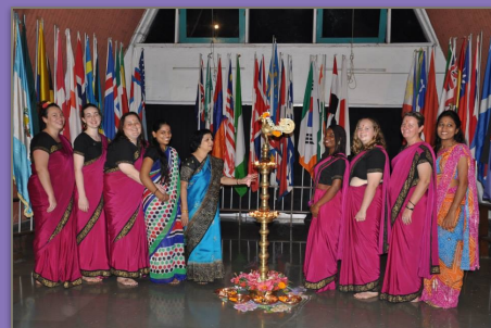
サンガム スタッフ

世界を変える、世界に影響を与えるアドボカシーは、今回のプログラムでも重要な言葉の一つです。アドボカシーの理解は難しい印象ですが、確認しながら、効果的に行動できる方法を学びました。次項の様なシートを使い、整理して行動することで、次に挙げるアウトカムについても成果を出していけると感じました。書き出すことで、整理でき、目標や目的が明確になります。