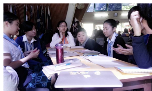
ファシリテーション