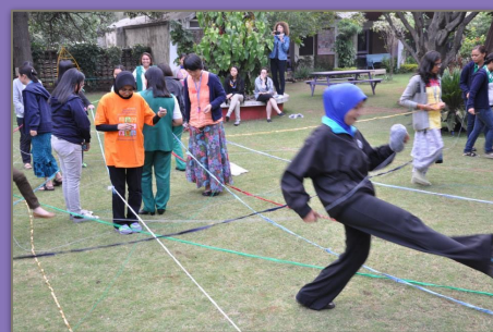
アクティビティの様子