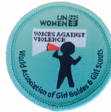
WAGGGS Voices against Violence badge