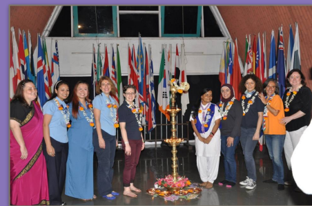
トレーニングメンバー